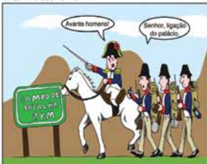
ENQUANTO ISSO NO FRONT...